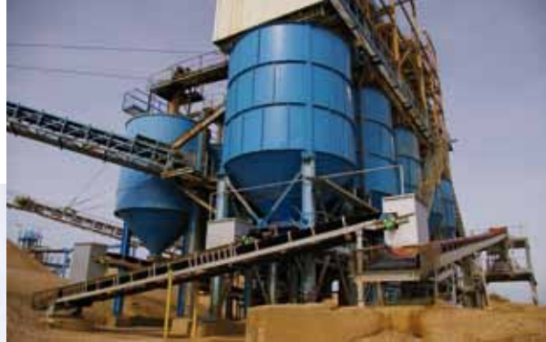
DIE KOMPLETTANLAGE in Dorsfeld, oben Nassaufbereitung, darunter Siloreihen mit Verladestation. Verladen wird über eine ganze Reihe von Bändern.