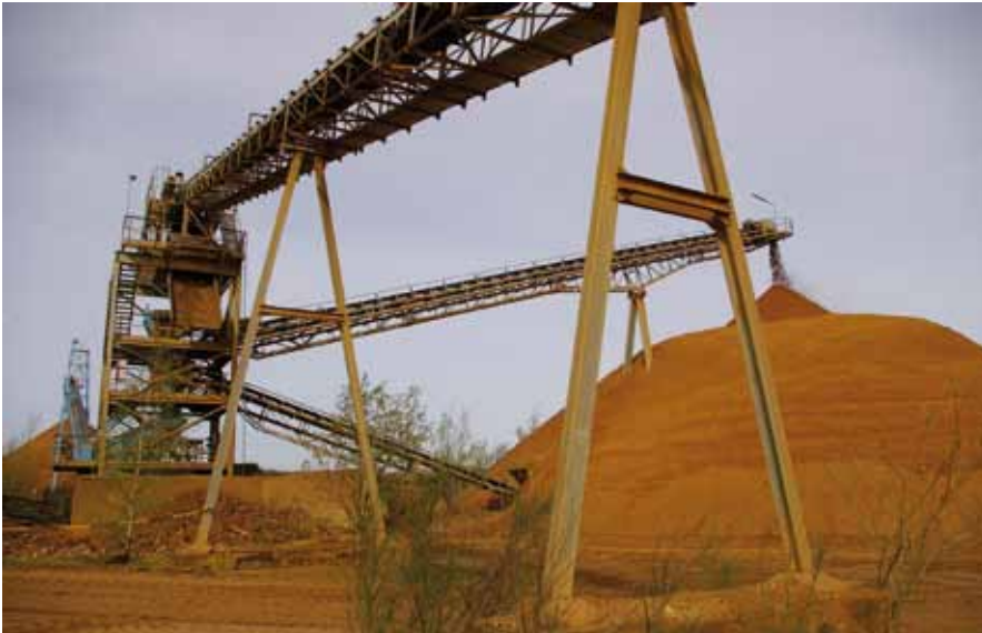
ERSTE KLASSIERUNG mit Rohkieshalde – und natürlich Transportbändern.