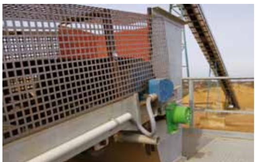
ZAHLREICHE Trommelmotoren (im Bild blau) treiben die Förderbänder der neuen Verladestation im Kieswerk Dorsfeld an.

Früher galten sie als die Wackelkandidaten: Besser also keinen Trommelmotor einsetzen, denn kam das Band zum Stehen, dann gab es ganz bestimmt bei diesem Antrieb ein Leck. Eine durchgreifende Qualitäts-offensive bei Herstellern, die dieses Problem tiefgründig anpackten, hat dieses Bild deutlich verändert.