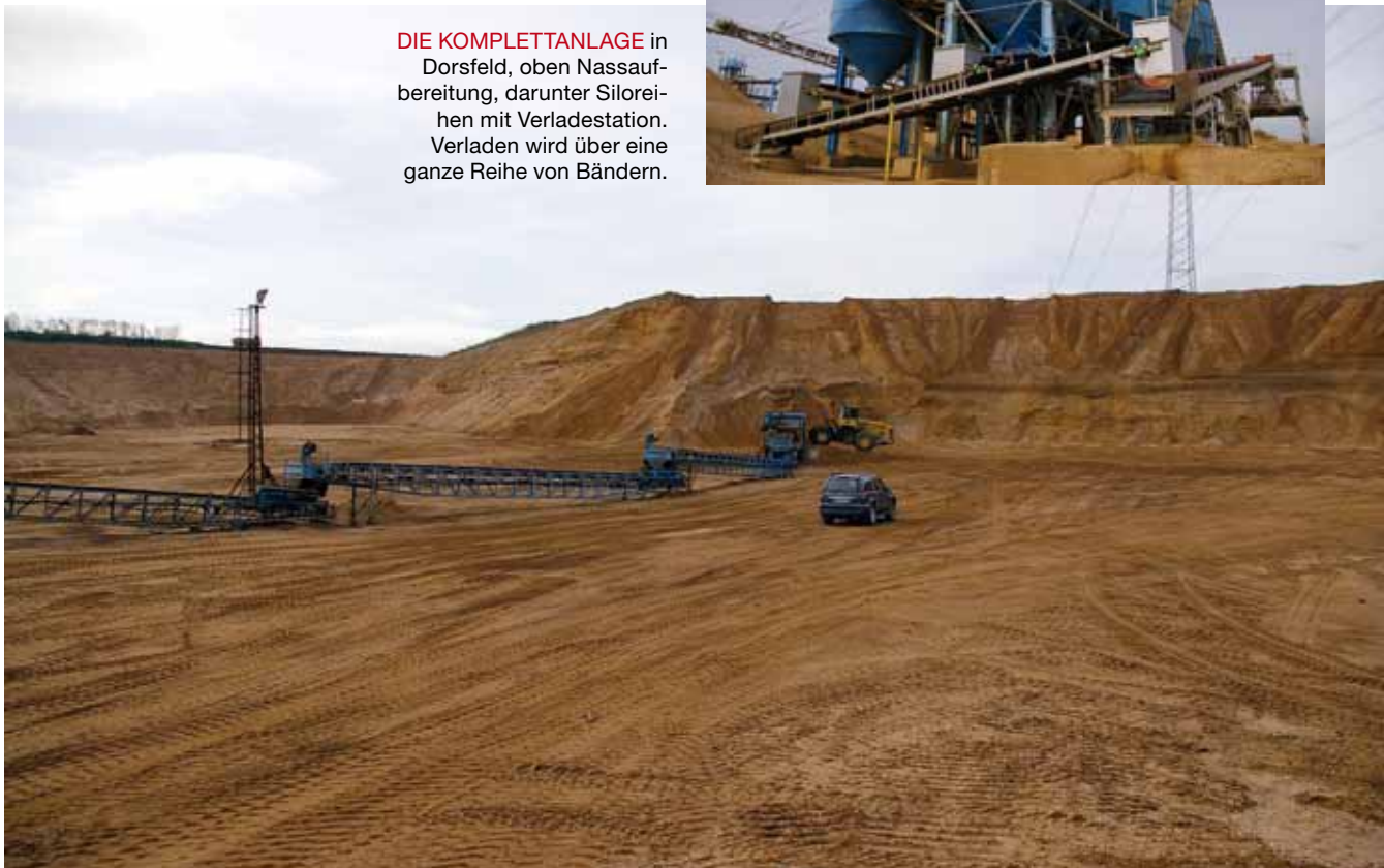
SCHON AN DER ABBAUFRONT endet die Arbeit der Radlader. Die wesentliche Transportarbeit obliegt diversen Bandanlagen.